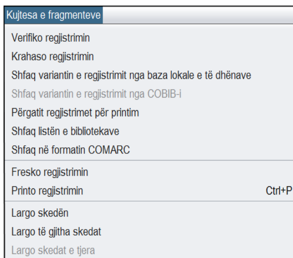
Figura 3.2-7: Kujtesa e fragmenteve – lista e metodave (i përzgjedhur është regjistrimi nga COBIB-i)

Metodat e caktuara nga menuja Kujtesa e fragmenteve mund t'i përzgjedhni edhe nga menuja e kontekstit (shih kap. 6).