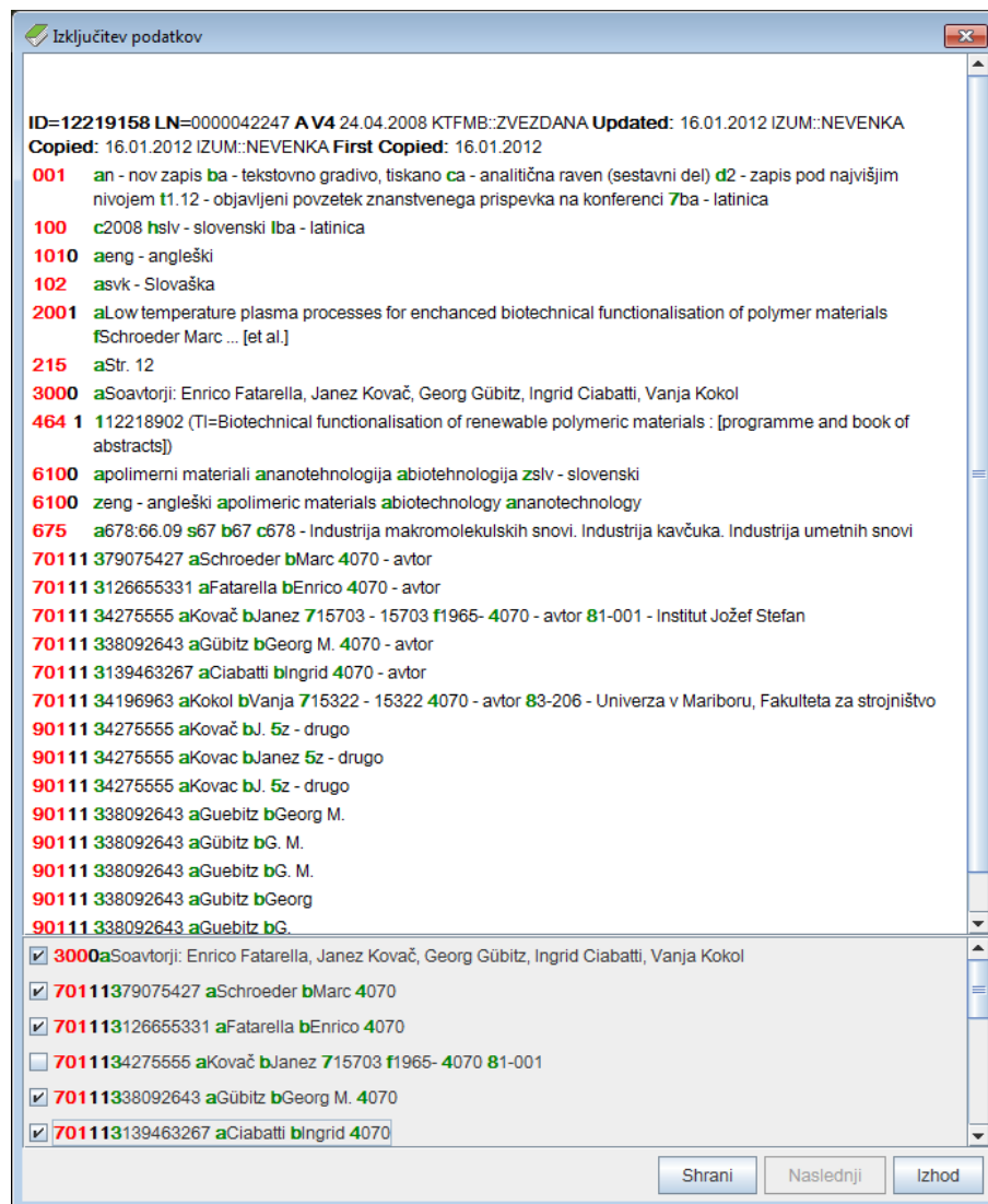
Slika 6.7-2: Okno Izključitev podatkov

4. Okno zapremo s klikom na gumb Izhod .