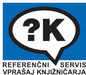
Slika 5: Barvni logotip