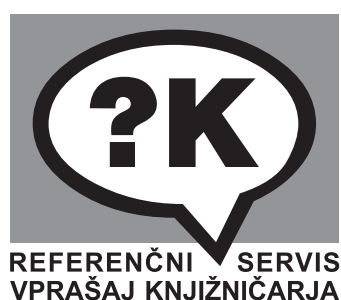
Slika 4: Črno-beli logotip