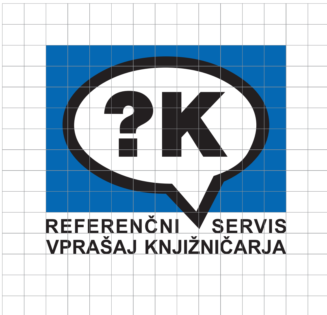
Slika 1: Konstruktivna mreža